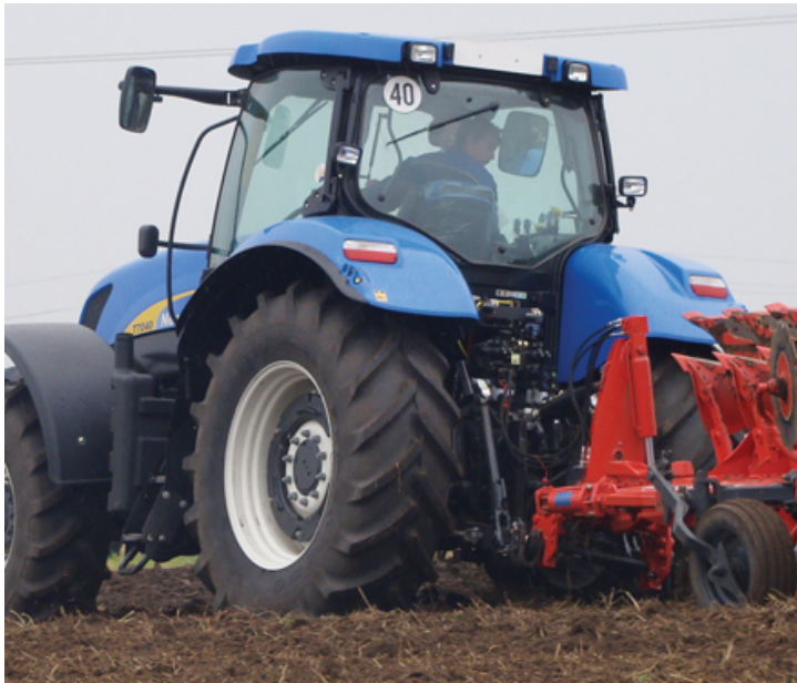
Descriere imagine: Tractor New Holland T7040

Capitalul joaca un factor important pentru redresarea exploatatilor agricole, dezvoltarea acestora fiind conditionata de posibilitatea de a investi. În ultimii 20 de ani însa, investitiile în agricultura s-au situat la un nivel scazut, implicit baza tehnico-materiala a exploatatilor s-a depreciat, acestea concurând la substituirea capitalului fix cu munca vie.